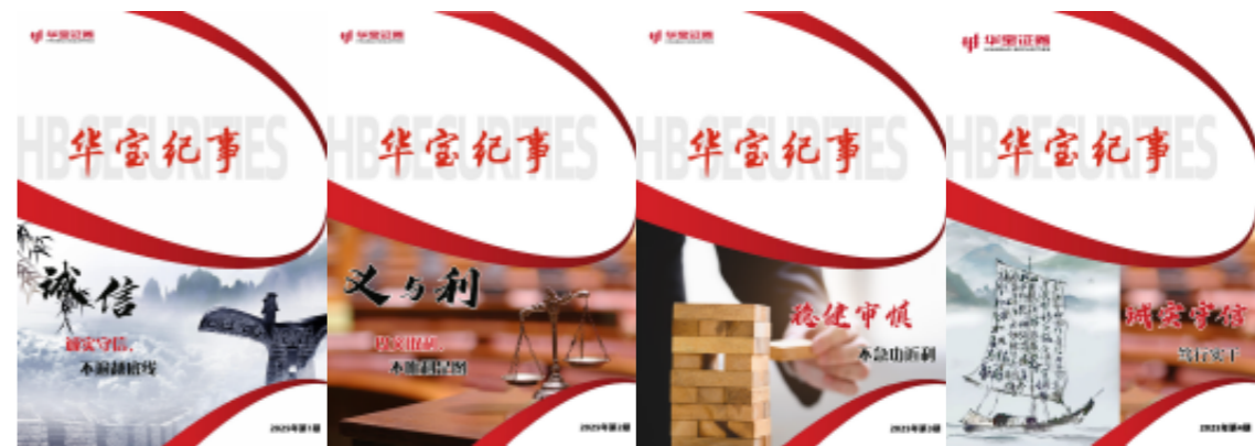
图：2025年公司共发布4期内刊《华宝纪事》

夯实文化品牌阵地。 2025年完成官网迭代优化，统一品牌视觉体系，擦亮对外专业形象；依托内部OA开设品牌专栏，常态化推送品牌规范内容；升级改版公司内刊《华宝纪事》，聚焦经营发展、文化理念传递、员工关怀等内容，筑牢内外宣传阵地。