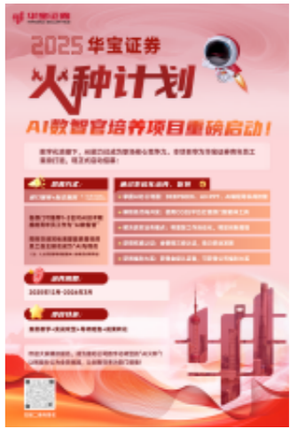
图：公司启动“AI数智官”培养计划

2025年，公司启动“火种计划”AI数智官专项培训，推动行业文化建设与数字化转型深度融合，助力全员提升AI应用能力；围绕“守正创新、提升服务”主题，开展多场专题培训，深入解读智慧数据分析平台、AI大语言模型内核等前沿内容，同时组织AIGC作品大赛、AI咖位战等创新竞赛，以赛促学、以赛促练，营造浓厚的学习实践氛围，推动创新文化落地生根。