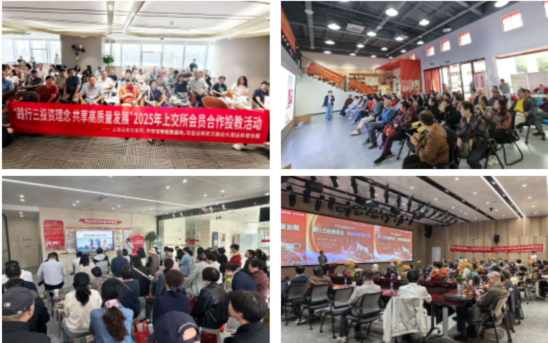
图:公司“四走进”投教活动现场

2025年，公司以“四走进”为核心抓手，组织开展“走进百校”“走进集团”“走进社区”“走进企业”系列投教活动，累计举办线上直播及线下活动200余场，覆盖参与人数超150万人次，切实提升广大投资者的金融素养和风险防范能力。