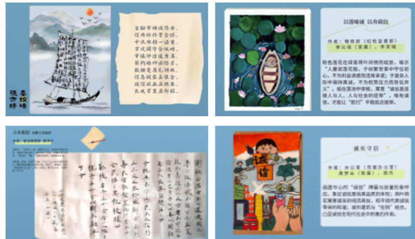
图：公司诚信文化征集大赛作品

提升组织活力，2025年公司举办第三届文化季活动，以“五要五不”为核心，开展主题研讨、知识答题、户外徒步等员工喜闻乐见的文化活动，着力营造团结协作、多元包容、积极向上的企业文化氛围。