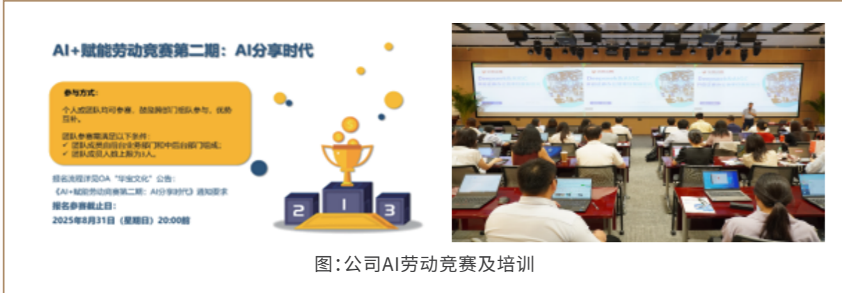
图:公司AI劳动竞赛及培训