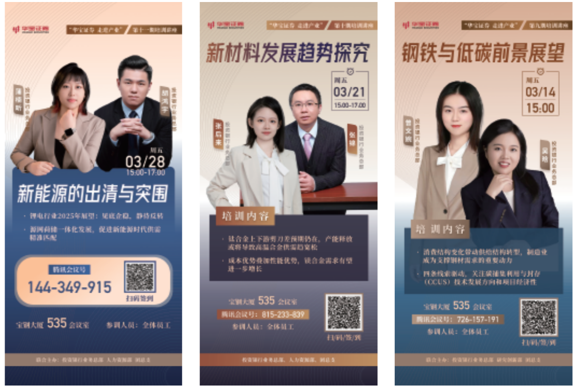
图：团总支举办“走进产业”系列培训讲座

团总支坚持以政治引领凝聚青年，通过图书角、产业讲座、联建共建等形式，推动团青工作与企业文化深度融合。2025年，团总支举办3期产业专题讲座，助力青年提升专业能力与产业服务水平。