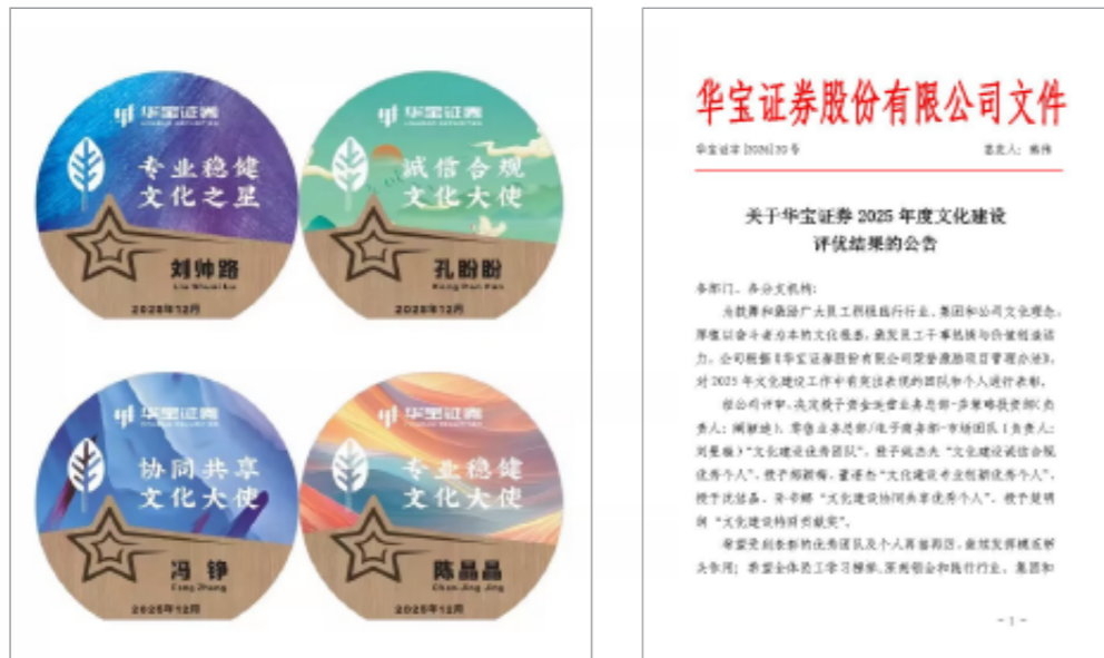
图：公司文化大使评选和先进表彰

树立先进典型。 公司设立“专业创新奖”“协同共享奖”“诚信合规奖”等文化专项奖项，2025年共表彰文化践行优秀团队2个、先进个人6名，以典型引领凝聚共识，推动全员自觉践行文化理念。