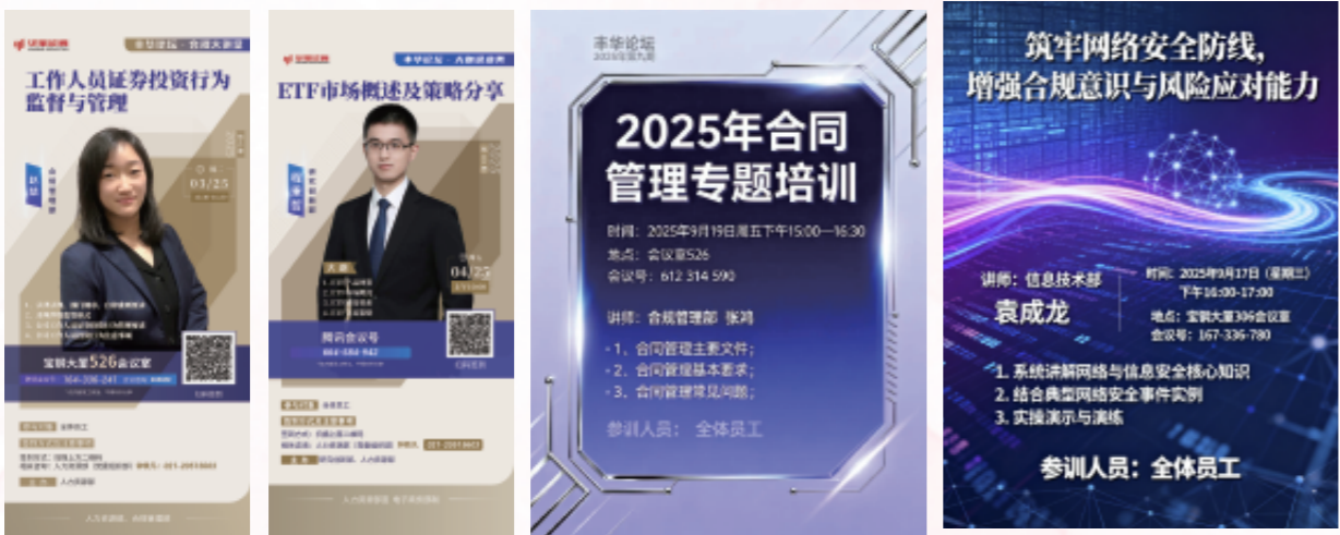
图:公司“丰华论坛”系列培训

立足全员综合素养提升,打造“丰华论坛”培训品牌。2025年度开展内外部各类培训12期,助力全体员工拓宽行业视野、更新专业知识、提升综合素养。