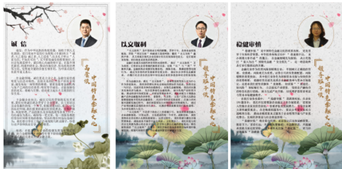
图：公司内刊宣贯“五要五不”核心要义

多维度宣贯《树立证券行业荣辱观的倡议书》《证券从业人员职业道德准则》。在公司办公场所显著位置，通过宣传展板、电子屏等形式展示中国特色金融文化、行业荣辱观要求等，营造“时时明荣辱”的浓厚氛围；在公司内刊、OA等开设专项宣贯专栏，定期刊发解读文章、践行案例等，引导员工深入学习、深刻领会，将行业荣辱观和职业道德准则融入日常工作、贯穿执业全过程，切实提升从业人员职业素养和合规意识。