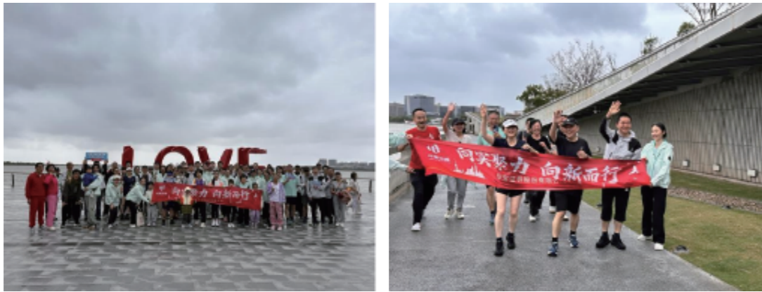
图：公司文化季跑步活动

讲好奋进故事。 组织员工踊跃参与2025年度中国宝武“宝武好故事”、AIGC创作、诚信文化征集等赛事，以图文、影像、创意作品等多元形式传递担当实干、诚信合规的价值理念。公司内部，深入开展一线走访访谈，挖掘基层团队履职尽责、专业服务的先进事迹，以鲜活文化叙事凝聚奋进合力，提升品牌温度与影响力。