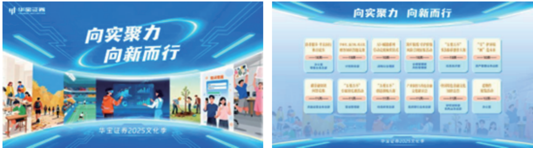
图：公司举办第3届文化季主题活动

打造特色品牌活动。 2025年公司紧扣中国特色金融文化要求，举办第三届“向实聚力 向新而行”文化季，开展以“五要五不”为主题的文化研讨、知识竞答、书法创作、创意比拼、老物件展等12项特色活动，丰富员工业余文化生活，厚植企业文化底蕴，持续做强文化季特色品牌。