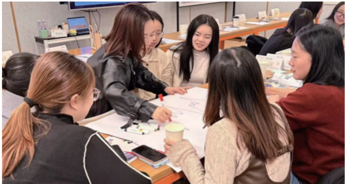
图：“证券投诉处理与心理韧性提升”专项培训与讨论

在协同保障体系建设方面，华宝证券打破部门与分支机构壁垒，建立起“总部统筹、分支联动”的协同机制，优化人力排班与应急响应流程，构建全方位、无死角的权益保护网络。应急回访机制建立后，日回访峰值突破3000户，有效保障400客服热线畅通，确保高峰时段客户诉求能够及时响应；营销咨询流程优化后，月均转交有效服务线索109户，实现客户需求的精准对接；严格落实首受理人责任制，强化客户诉求的全流程责任追溯，确保客户诉求“件件有回应、事事有落实”。在人员能力锻造方面，人力资源部联合营运管理部组织开展“证券投诉处理与心理韧性提升”专项培训，30余位一线员工通过真实案例演练、互动游戏及AI工具分享，深度掌握以“方向盘”理念锚定客户需求、以“发动机”模型驱动持久战力、以“导航仪”策略精准破局的投诉处理方法论，实现从被动接听至主动守护的服务能力跃升，为客保一线注入专业与温度并重的持久战力。通过协同作战与能力淬炼双轮驱动，公司形成了上下联动、左右协同、高效运转的客保工作格局，全面提升了权益保障的整体效能。