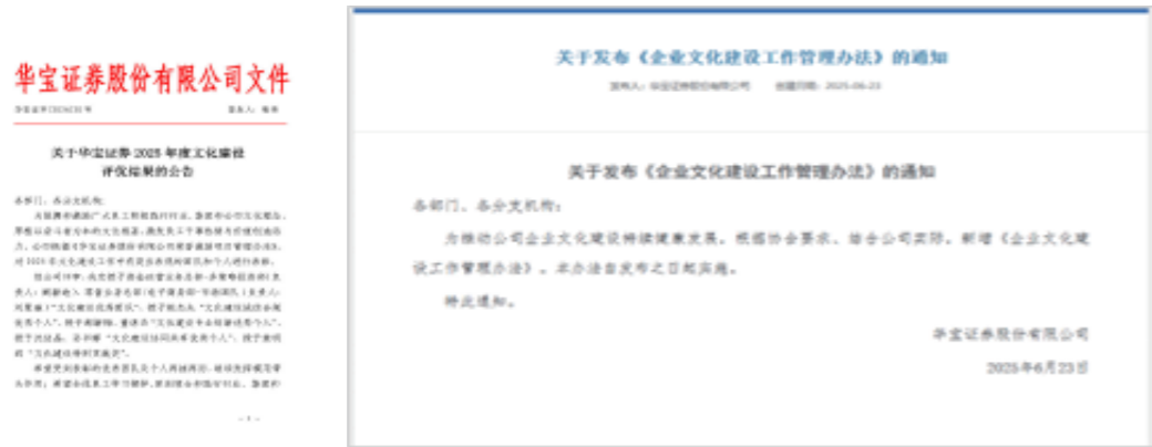
图：公司发布年度文化建设红头方案和专项管理办法

2025年，公司制定发布了《企业文化建设工作管理办法》专项制度，印发《华宝证券2025年文化建设工作暨践行中国特色金融文化行动方案》，以制度化、体系化方式推动文化建设落地实施，并通过定期督办、过程跟踪、闭环反馈等机制，确保文化理念在经营实践中落细落实。