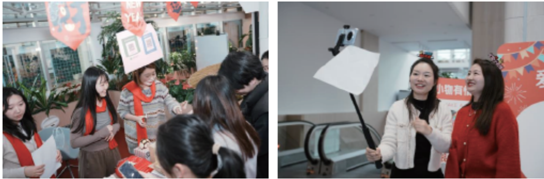
图：公司文化季义卖集市活动