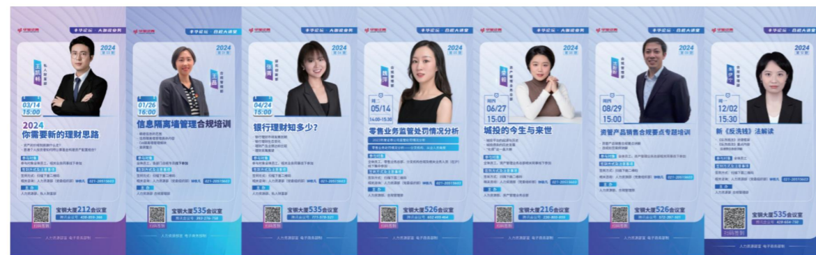
丰华论坛系列培训

公司制定了支撑战略发展的全面培训计划，分层分类开展专项培训，着力提升员工的专业水平。针对新入职员工开展“华新计划”专项培训；针对公司管理层开展“启山”“启林”专项培训研讨；针对公司全体员工持续开展“丰华论坛”系列培训。2024年共开展华新计划4期，启山培训2期，丰华论坛14期。