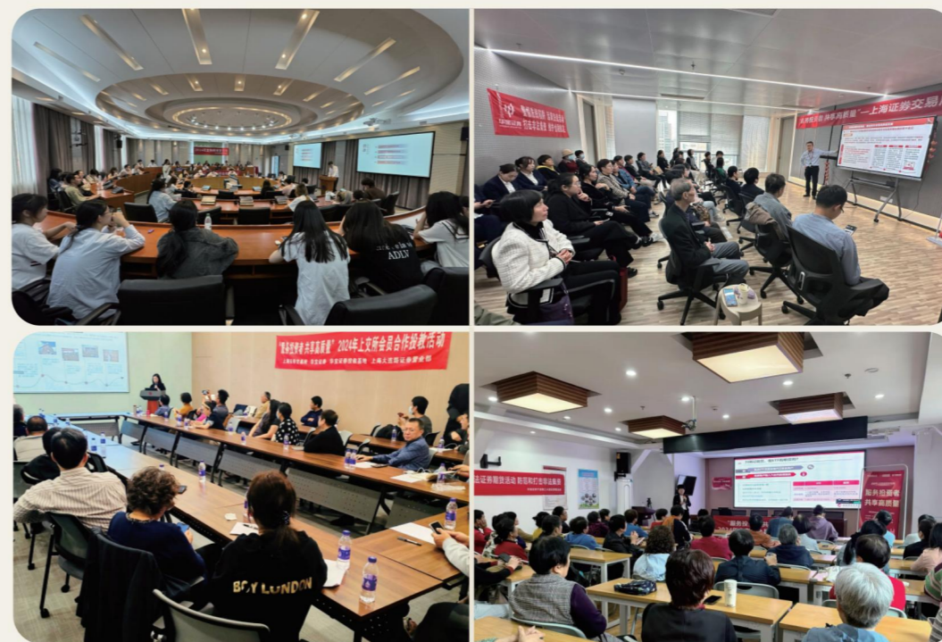
公司开展“四走进”投教活动

在开展投教工作中，公司结合“聚焦产业生态圈、打造产融结合平台”的公司战略，通过线上线下双向结合的方式，向中国宝武产业链企业深入推进“投教 + 产融”的综合性金融服务。2024 年，公司针对中国宝武用户开展两百余次线下活动，提升员工对金融风险的认知，对科学理财的学习，对金融诈骗的警示，做好用户金融服务的长期陪伴。