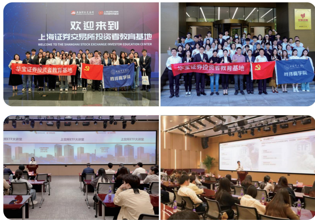
公司与上海杉达学院合作开展各类共建活动