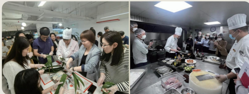
公司组织后厨开放日活动和员工包粽子活动