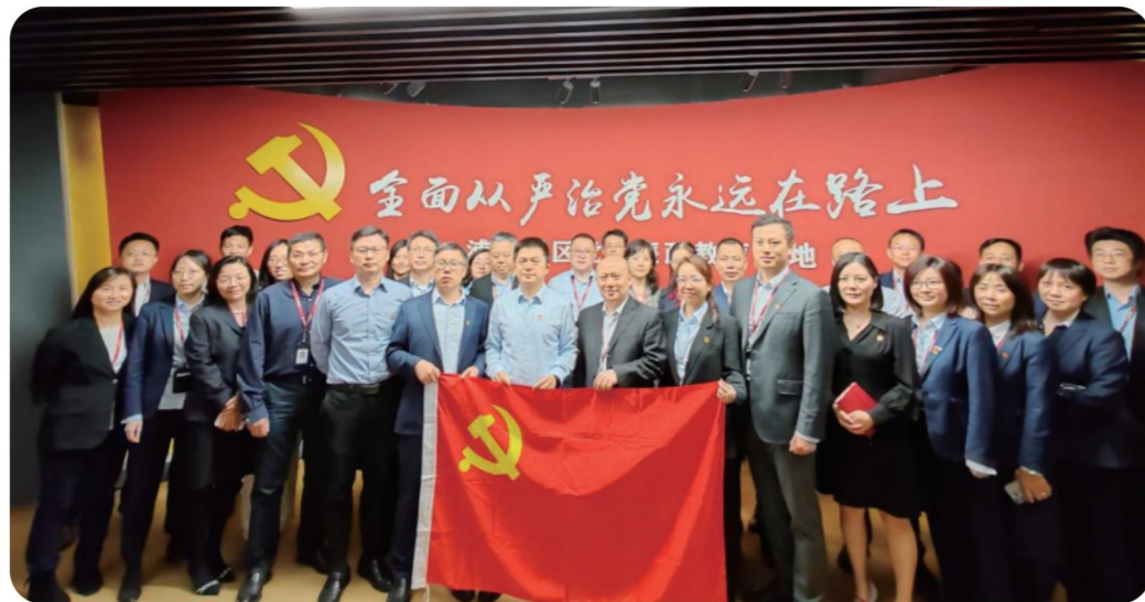
组织参观党风廉政教育基地

公司党委以党纪学习教育为契机，推进领导干部和广大党员的党纪党规学习。制定党风廉政建设和反腐败重点工作，细化为6个工作项目和13项具体措施，并按照时间节点完成各工作项目和工作举措。党委书记与班子成员集体廉政谈话9人次，强调分管领域党风廉政建设要求；纪委书记与各业务分管领导以“廉洁情况谈话”的形式提示廉政风险点7人次；对新任职干部开展廉洁谈话14人次，组织领导人员签署《党风廉政建设和反腐败工作责任书》《自律承诺书》。紧盯节点纠“四风”树新风，守住节日廉洁关。组织召开警示教育会议通报和剖析解读公司近年来查处的违规违纪案例，集体观看金融领域警示教育片，在业务条线召开党纪学习教育暨廉洁从业座谈会。