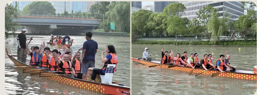
公司开展赛龙舟活动, 弘扬传统文化, 增强组织活力