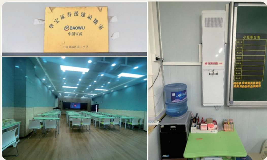
公司帮助帮扶小学建设美丽校园

持续打造智慧课堂帮扶品牌： 公司将“美丽校园”和“成长成才”纳入对帮扶县教育帮扶的重点规划，智慧课堂帮扶金额达 189.5 万元，帮助帮扶小学浴室改造、食堂改造及教学信息化等项目，助力帮扶县教育事业的发展。