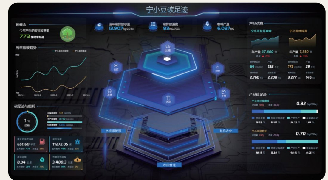
“宁小豆”咖啡碳足迹平台示例

助力“双碳振兴”示范项目： 2024年，公司推动“华宝证券碳积分商城”在“随申办”碳普惠专区上线，作为证券行业首个碳积分商城，以数字化手段促进绿色低碳发展，带动公众广泛参与绿色行动；公司基于宁洱县生态产品价值体系，创设普洱市首款零碳咖啡产品，深化建设“双碳目标驱动绿色循环发展创新示范”，促进该款咖啡销售额同比2023年增长超30%，带动咖农增收。