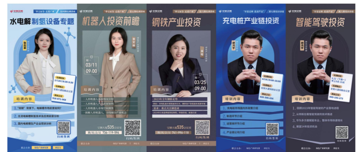
走进产业系列培训

公司团总支持续推进“青年图书角”建设，2024年共开展4期读书活动，为团员青年们搭建了阅读提高的学习阵地；2024年，团总支承办了6期产业讲座，帮助青年掌握服务产业的技能，促进其职业提升。