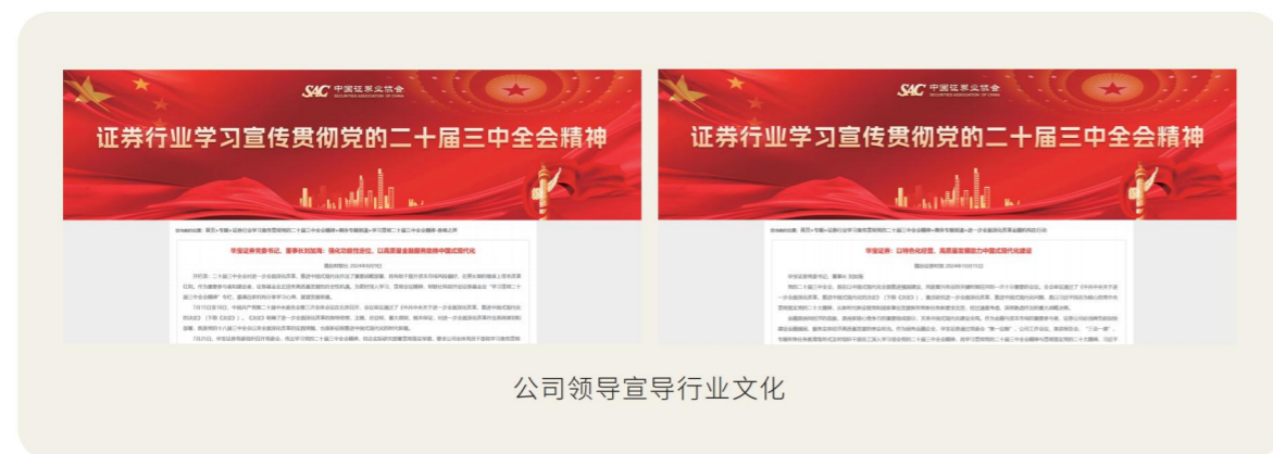
公司领导宣导行业文化