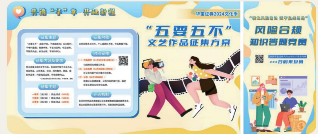
公司举办“五要五不”作品征集和风险合规知识答题活动

劳动竞赛：让合规文化活起来。 公司举办了“五要五不”文艺作品征集活动，面向全体员工征集原创作品，共收到形式多样的优秀作品100多份，涵盖书法、绘画、诗词、摄影等。公司组织开展的2024年风险合规知识答题竞赛，参赛达439人次。竞赛内容围绕法律法规、外部监管要求、职业道德、公司制度、风险合规管理要求等，通过互动问答形式，引导员工熟练掌握内外部法规和职业准则，厚植道德标准，筑牢风险合规防线。公司大投行条线举办“走进产业·专业合规知识竞赛”活动，竞赛内容涵盖投行合规知识、员工执业准则等，形式包括必答、抢答以及随机选题等多种题型，同时穿插趣味小游戏，增强活动的趣味性和参与感。