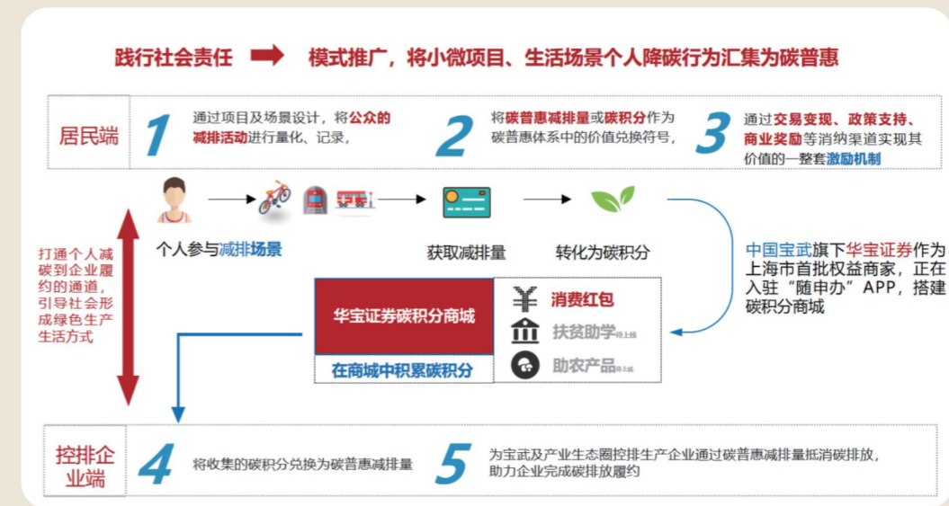
公司碳积分商城运行模式

权益产品设计与上架： 积分商城提供多种权益产品供用户兑换，例如支付宝红包、优惠券等。权益产品由华宝证券与合作企业共同设计，确保产品的多样性和吸引力。