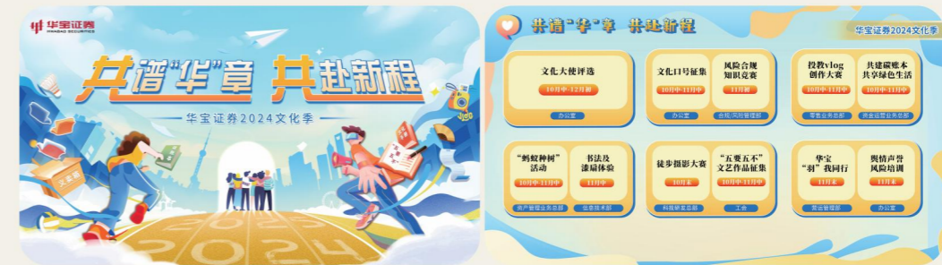
公司举办第二届文化季活动

打造品牌活动。 在成功举办首届文化季活动的基础上，2024年公司持续发力，进一步丰富文化季活动的形式与内涵，策划并成功落地了第二届文化季活动。第二届文化季活动举办13项内容丰富的活动，覆盖绿色、廉洁、合规、投资者教育等多个领域，在公司内部营造积极向上、充满活力的文化氛围，进一步巩固了文化季的品牌形象。第二届文化季活动中增设了“义卖集市”活动，得到员工积极参与，活动最终募集到万余元，并全数用于对口帮扶县，为乡村振兴事业注入新的活力。