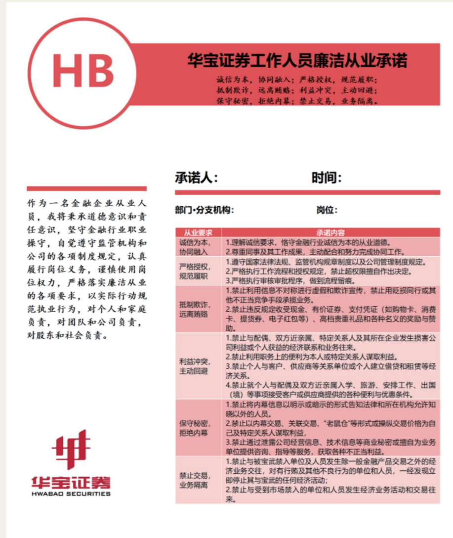
组织参观党风廉政教育基地

承诺体系：让廉洁自律具象化。 公司构建了多层级的承诺体系，其中纸质版承诺书存档备查、电子版录入管理系统，通过这种形式让抽象的职业承诺转化为可视、可感、可追溯的行为准则。2024年，公司组织签订《党风廉政建设和反腐败工作责任书》《领导人员廉洁从业自律承诺书》《廉洁从业承诺》强化员工的职业道德意识，压紧压实职业道德管理责任。