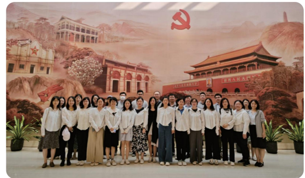
公司第七党支部组织参观一大会址

落实意识形态工作责任，抓牢意识形态工作主动权。公司党委会专题研究意识形态工作，明确重点工作任务，特别强调要做好网络意识形态工作。开展落实意识形态工作责任制情况专项督查。加强网络信息管控，部署网络安全防护监控，常态化开展网络安全和数据安全风险监测。组织全体员工开展网络安全教育培训，提高员工安全意识和防护能力。